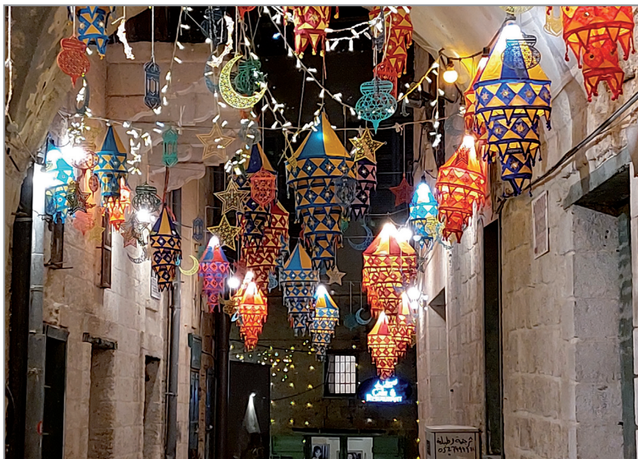
Straßenbeleuchtung in der Altstadt von Nazareth